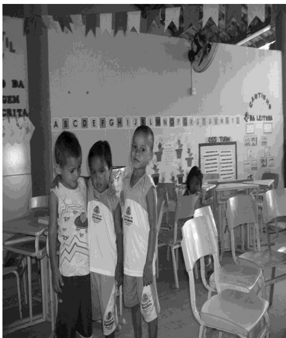
Fotografia 23 — Produção das crianças da turma Ciranda: registro da afetividade entre as educadoras e as crianças e das crianças entre pares.