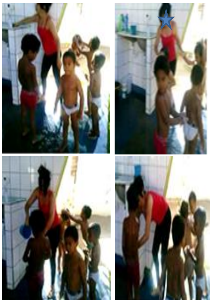
Fotografia 24 — Registro da forma como os momentos de banho são desenvolvidos com as crianças da turma Catavento.

Em campo, assim como as crianças, pude registrar a importância das brincadeiras desenvolvidas entre as mesmas para dramatizar elementos desafiadores das práticas de violência policial vivenciadas em suas comunidades e para negociar os diferentes papéis e posições sociais em seus grupos de referência na turma que compõem. As brincadeiras também foram um importante recurso lúdico utilizado pelas crianças para subverter e reinventar de forma autônoma alguns contextos e rígidas práticas mecanizadas da creche em que estavam inseridas. No desenvolvimento do mesmo processo (brincadeiras) as crianças também reproduziram elementos dos signos sociopolíticos e ideológicos em que são formadas, como foi o caso, por exemplo, da exclusão social das crianças negras e mais tímidas das turmas pesquisadas, questões que serão aprofundadas no próximo eixo analítico.