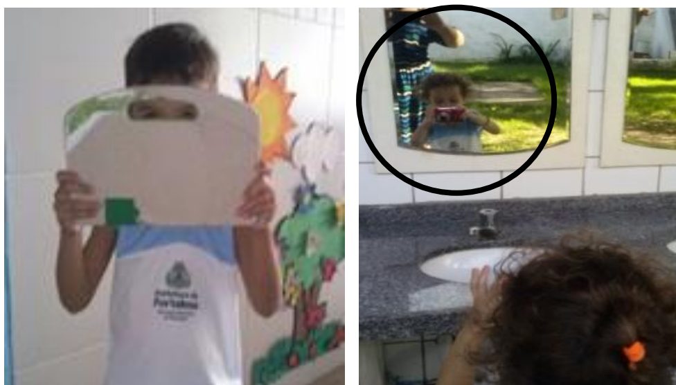
Fotografia 56 - Crianças, suas interpelações e enquadres.

Registros expressos nas seguintes fotografias, em que fui retratada pelas crianças, como os recursos que tinham, como parte constitutiva do contexto da pesquisa em pretensão de analisar. No mesmo contexto também fui interpelada pelas professoras, ao propor o desenvolvimento colaborativo do estudo, sobre minhas implicações (sociais, pessoais e acadêmicas) com o desenvolvimento da pesquisa. Diante de tal contexto, que compartilho a indagação com todos os profissionais da área no convite à reflexão sobre como estamos construindo ético-politicamente os processos de formação que, através de diferentes estratégias e múltiplos contextos compomos.