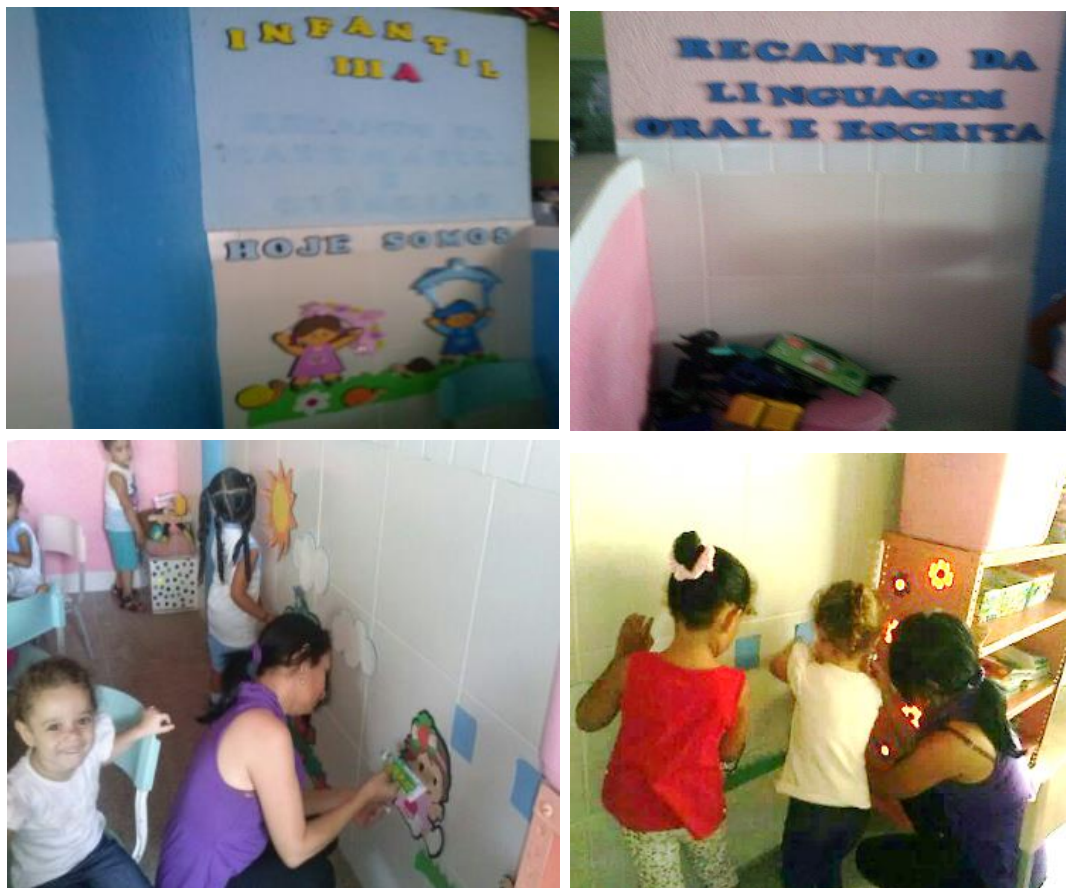
Fotografia 2 – Compêndio de registros nas paredes da sala de atividades da turma Catavento/creche Esperança.