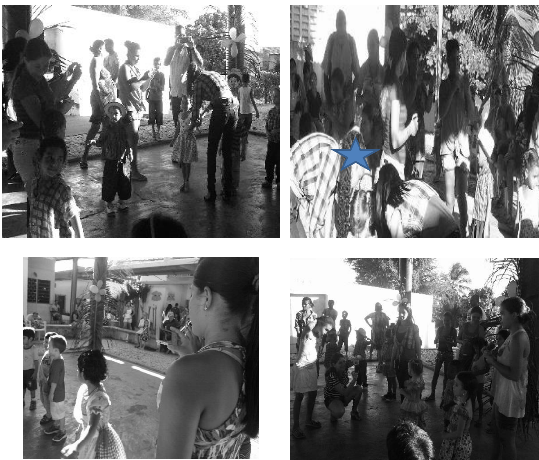
Fotografia 28 — São João na creche Esperança, complemento.

Segue o registro visual em que a produção de fotografias se torna o principal foco da atividade festiva para os pais e responsáveis pelas crianças.