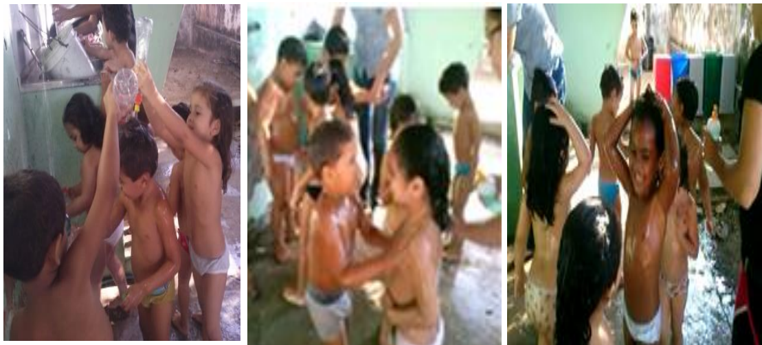
Fotografia 25 — Registro da forma como os momentos de banho são desenvolvidos com as crianças da turma Girassol.