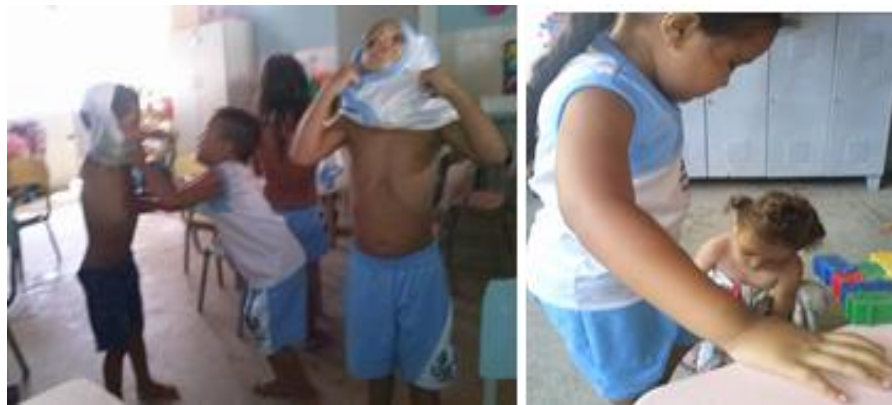
Fotografia 53 — Registro das crianças ajudando umas às outras no aprendizado de se vestirem e calçarem de forma autônoma