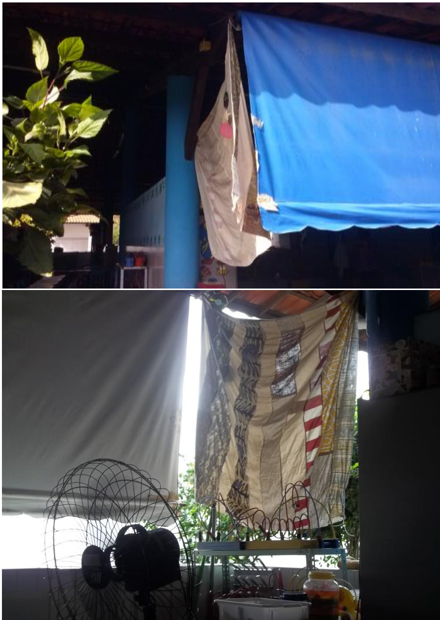
Fotografia 1 - Registro de toldo improvisado numa das salas de atividades pesquisadas na turma Esperança