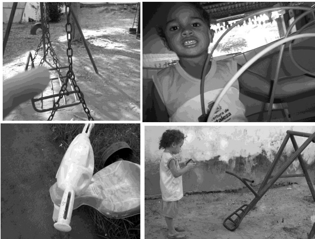
Fotografia 21 — Produção das crianças da turma Catavento: registro dos brinquedos e das brincadeiras

As fotografias acima foram produzidas pelas crianças sobre suas experiências formativas na creche, em que se destaca o papel dos brinquedos e das brincadeiras para sua formação, assim como das interações socioafetivas que são desenvolvidas pelas crianças entre pares e com as educadoras.