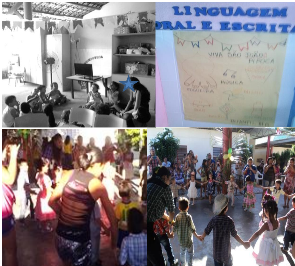
Fotografia 27 - São João na creche Esperança.

Segue registro fotográfico que complementa o diário de campo citado.