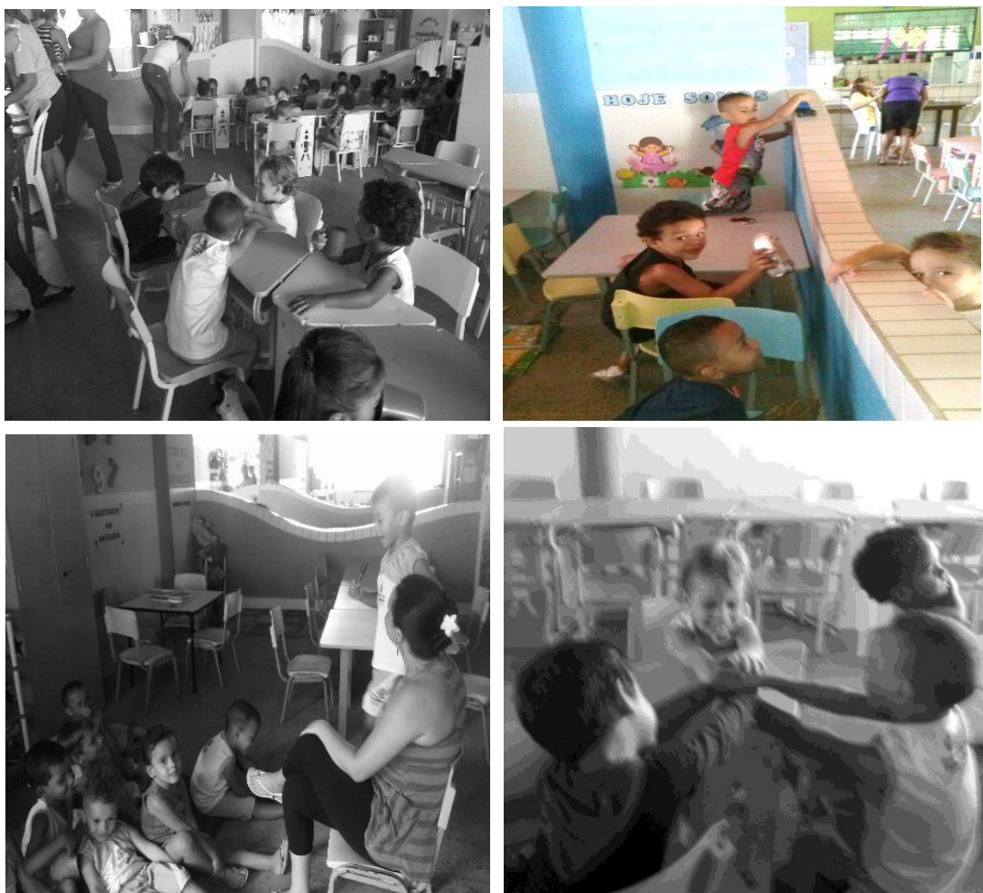
Fotografia 3 - Compêndio de imagens sobre a apropriação dos espaços e rotinas na creche Esperança.

A composição de registros abaixo (Fotografia 3), evidencia a forma criativa com que as crianças da creche Esperança se apropriam dos ambientes e rotinas, enquanto “esperam” pelas próximas orientações da professora. No compêndio, também é possível identificar a criatividade de uma das professoras na proposição de uma atividade de canto e expressão artística das crianças. Opto por apresentar os tais registros por considerá-los deveras característicos na forma como as atividades formativas são cotidianamente (re)criadas nesta creche.