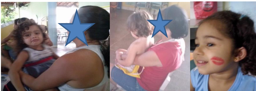
Fotografia 34 - Afetividade nas interações desenvolvidas entre as crianças e as educadoras no contexto da creche Girassol

Seguem fotografias produzidas sobre as trocas socio-afetivas desenvolvidas pelas educadoras com as crianças na rotina da turma Girassol.