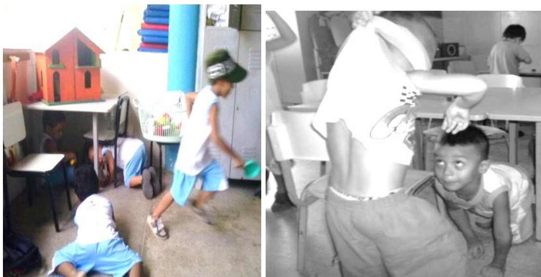
Fotografia 55 — Registro da brincadeira de polícia, ladrão e “baculejo” entre os meninos da turma Ciranda.