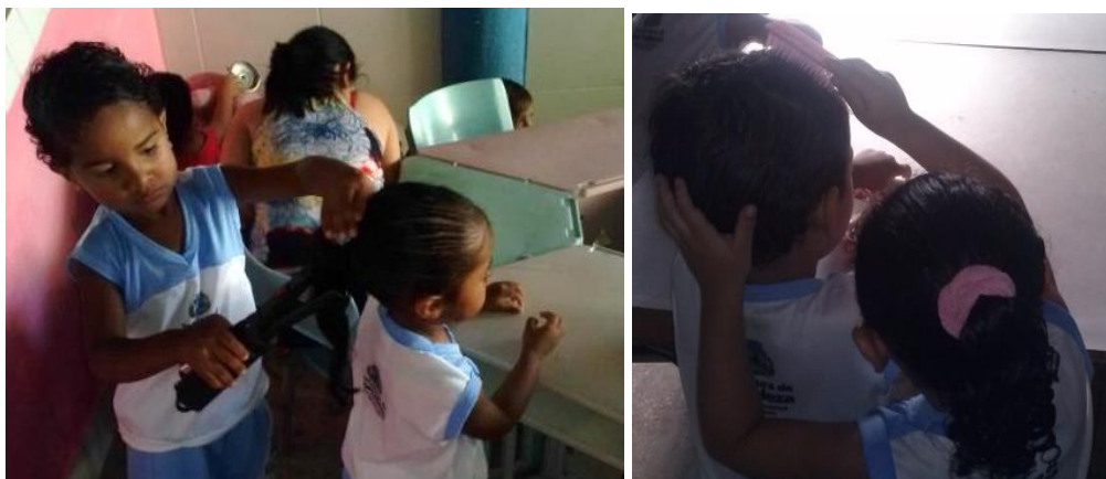
Fotografia 52 — Registro das crianças cuidando umas das outras; arrumação dos cabelos dos colegas após o banho