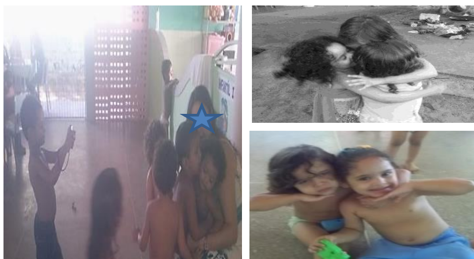
Fotografia 22 — Produção das crianças da turma Girassol: registro da afetividade entre as educadoras e as crianças e das crianças entre pares: