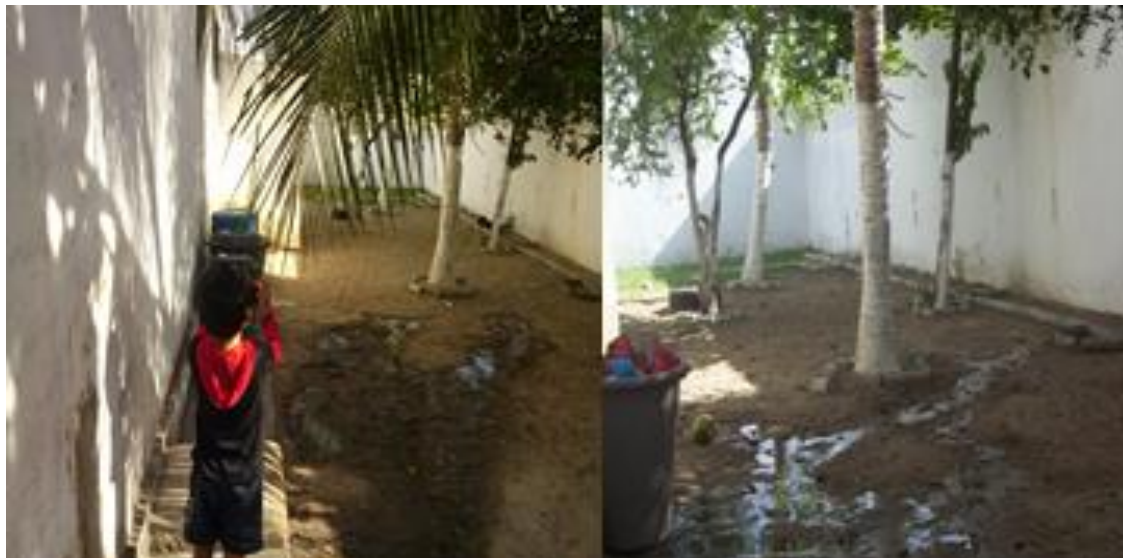
Fotografia 16 – Perspectivas de Eric sobre a creche.