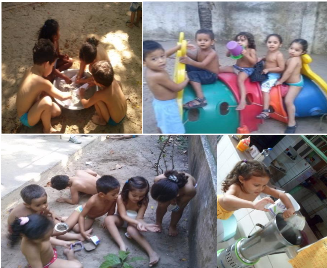
Fotografia 5 - Compêndio em que registro a diversidade de atividades realizadas em diversos espaços da creche Novos Horizontes.