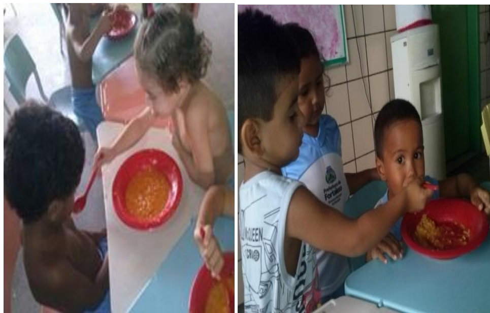
Fotografia 51 — Registro dos cuidados das crianças desenvolvidos entre elas nos momentos de alimentação.