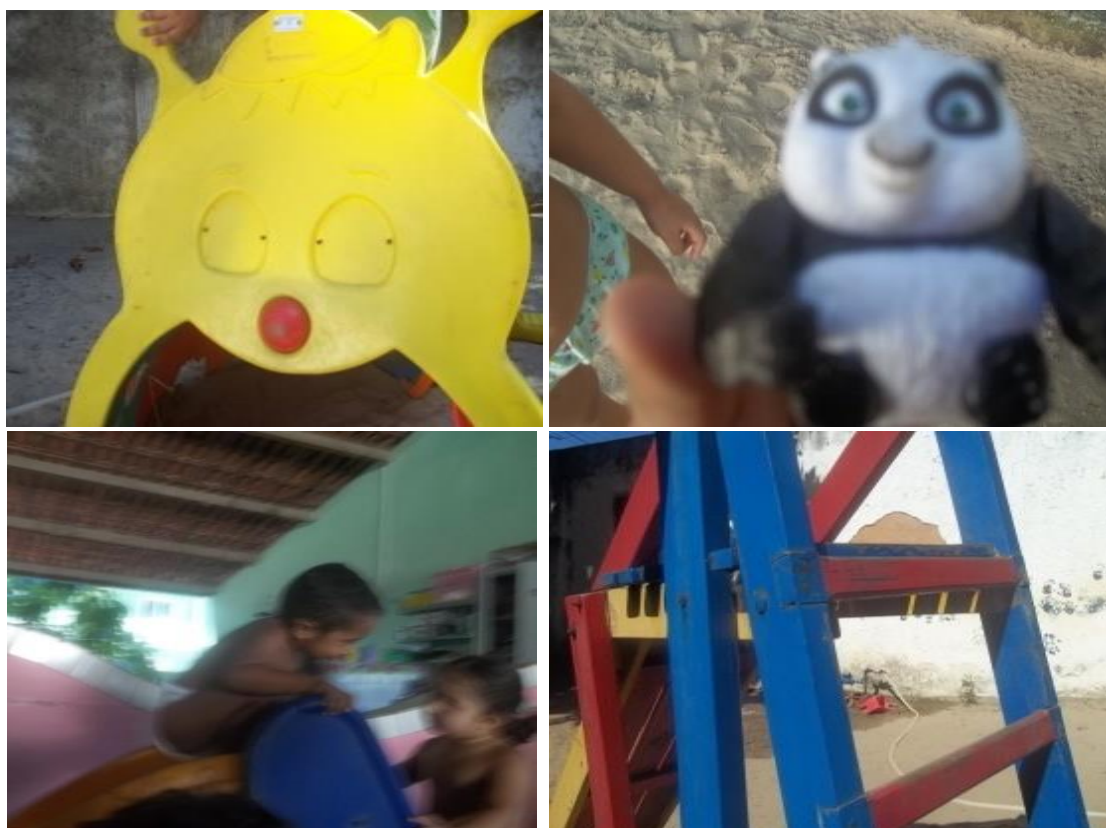
Fotografia 20 - Produção das crianças da turma Girassol: registro dos brinquedos e das brincadeiras