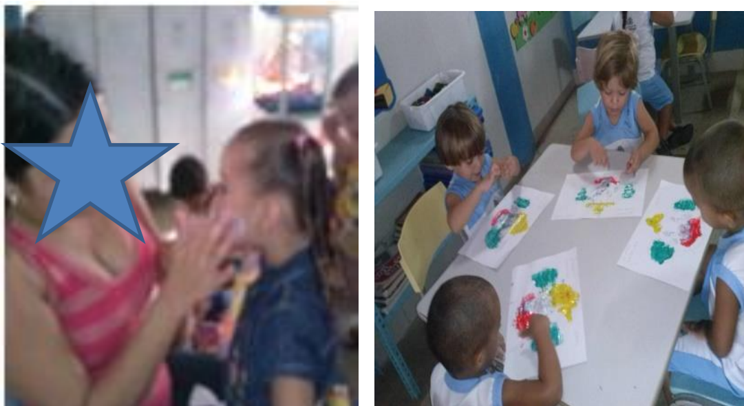
Fotografia 45 - Pintura no rosto da Estela (esq.) e Pintura de dedo: palhaços desenhados pelas educadoras em sala (dir.)

A seguir, apresento as fotografias e a transcrição da fala das professoras sobre a situação trabalhada.