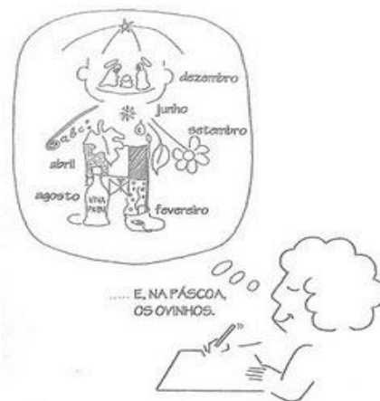
Imagem produzida por Tonucci (1997) no livro “Com olhos de criança”

desenvolvimento das festividades na instituição. A realidade descrita, também foi crítica e criativamente problematizada por Tonucci (1997) na imagem reproduzida a seguir, na qual se percebe que a formação humana e a constituição da criança são todas fracionadas em consonância com a representação das datas festivas no planejamento que orienta as práticas no contexto da Educação Infantil, como fora desenvolvido nas duas creches e pesquisadas.