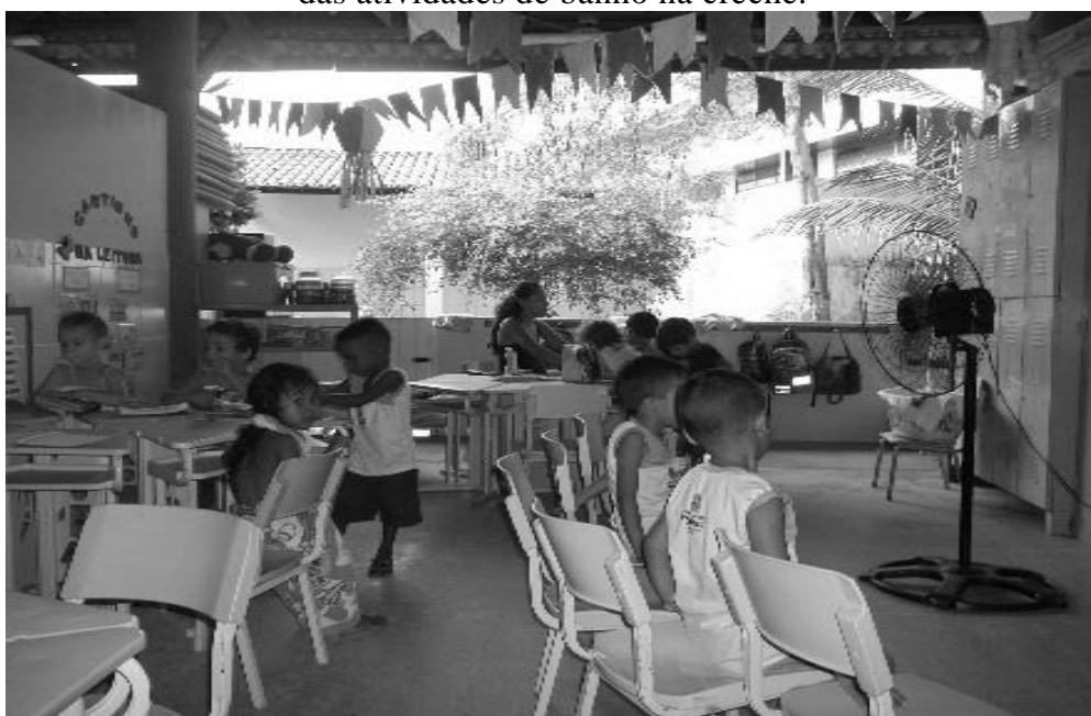
Fotografia 36 — Registro da forma como as crianças negras da turma Catavento são deixadas recorrentemente por último na organização das atividades de banho na creche.