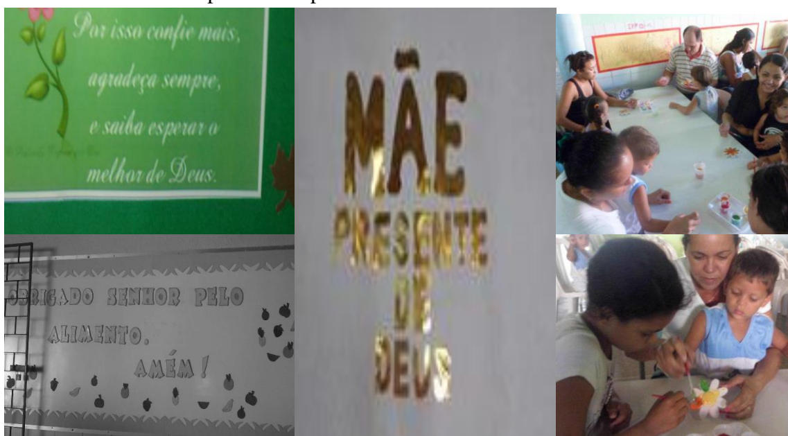
Fotografia 29 — Referências religiosas nas mensagens produzidas para o dia das mães na creche Girassol

“Obrigada, senhor, pelo alimento, amém.”