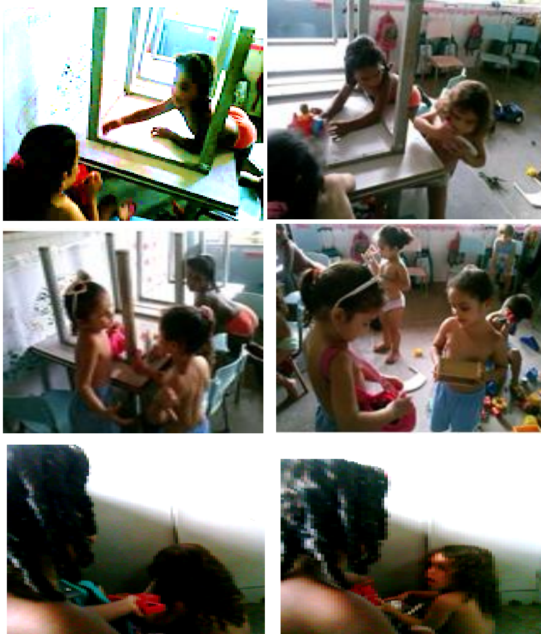
Fotografia 49 — Recortes de imagens do episódio interativo registrado em vídeo