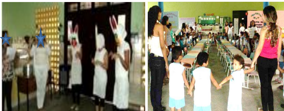
Fotografia 12 - Registro da comemoração da páscoa, desenvolvida pelas crianças e profissionais da creche Esperança.