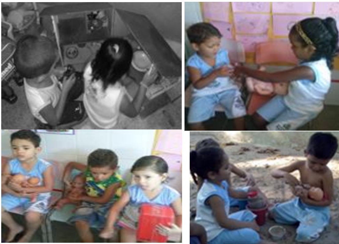
Fotografia 32 - Registro de como as crianças vivenciam as relações de gênero entre pares nas turmas Ciranda e Girassol

compreender e transformar as relações sociais nas quais participam de forma crítica e inovadora. O potencial das brincadeiras para problematização das relações de gênero, no contexto da Educação Infantil, também foi apontado nos estudos de Finco (2003 e 2007), Costa (2004) e Chechin e Bernardes (1999), sendo esta, uma importante indicação de linguagem de trabalho lúdico com as crianças sobre a temática.